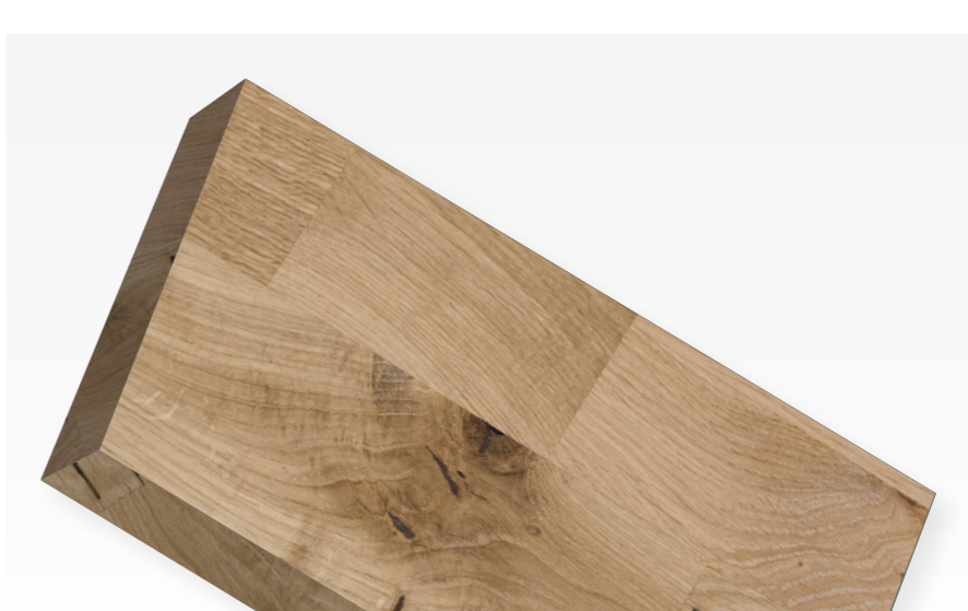
Oplevering CIRCL paviljoen