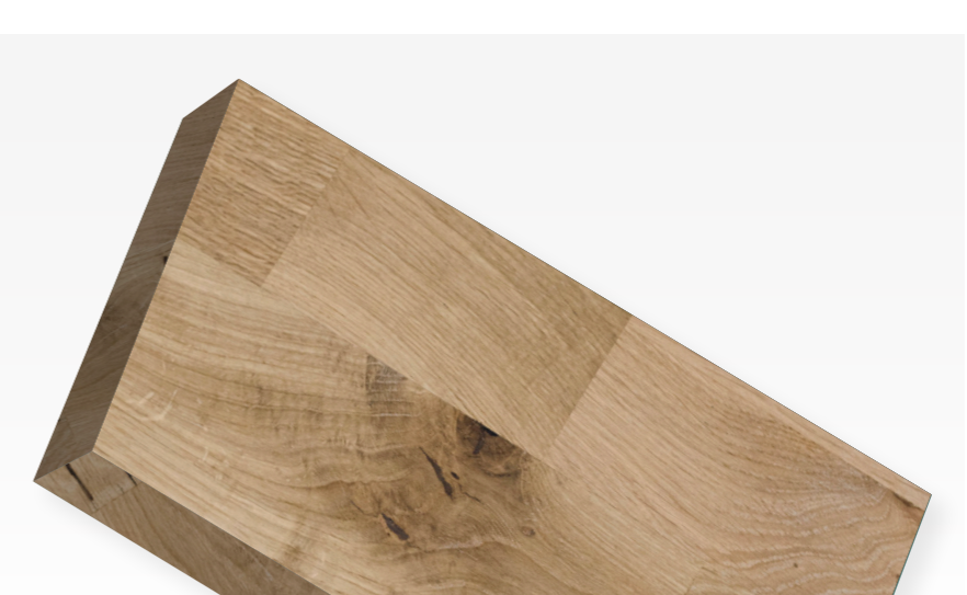
Oplevering CIRCL paviljoen